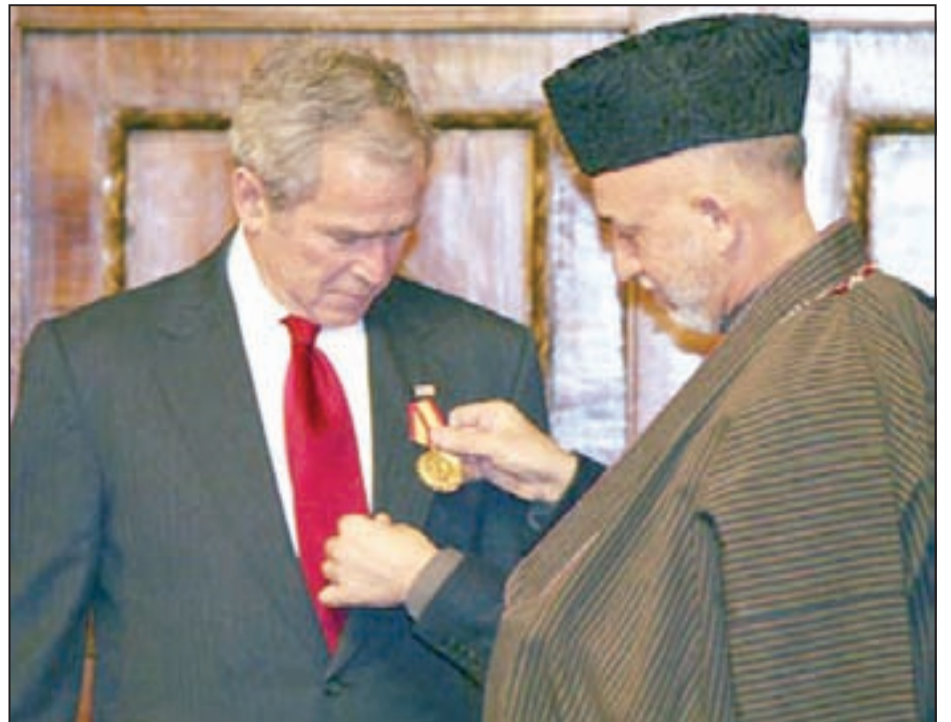
Presidente Afgano Hamid Karzai a ricibi e mandatario Mericano

Segun encuestanan, mayoría di mericano ta di opinion cu Washington a kiboca ora nan a invadi Irak na 2003. Bush a manda Merca den un guerra contra e regimen di Saddam Hussein alegando cu informacion di inteligencia tabata indica cu Irak tin arma di destruccion masivo. E armanan nunca